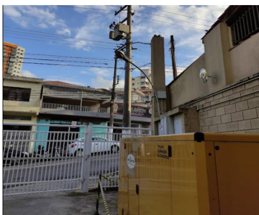
Figura 2 - Local de Instalação